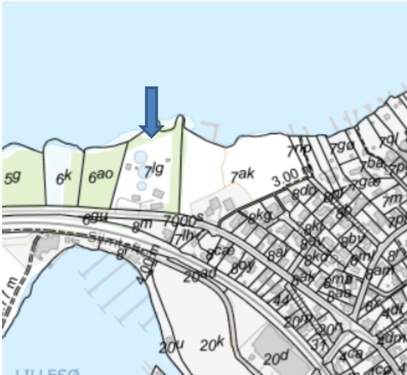
© Kortet må alene anvendes iflg. aftale med kortejere. Pil viser matr.nr. 7 lg Siim By, Dover. Ry Rensningsanlæg er beliggende på matriklen.