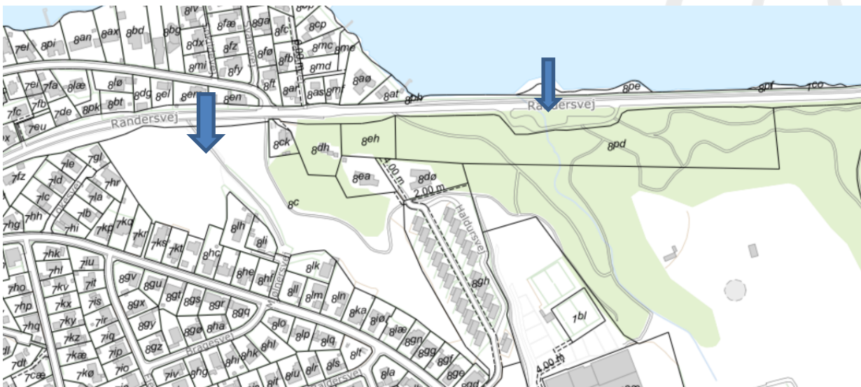
© Kortet må alene anvendes iflg. aftale med kortejere. Pilene angiver matr.nr. 8c og 7000t Siim By, Dover. Matriklerne er hhv. grønt område og en vejmatrikel.